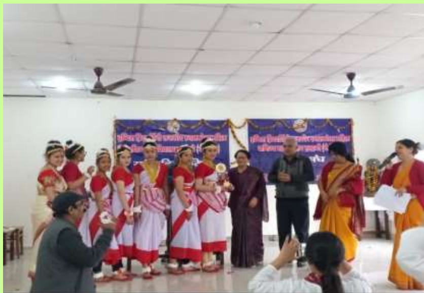
RESULT DECLARATION AND PRIZE DISTRIBUTION BY THE PRINCIPAL