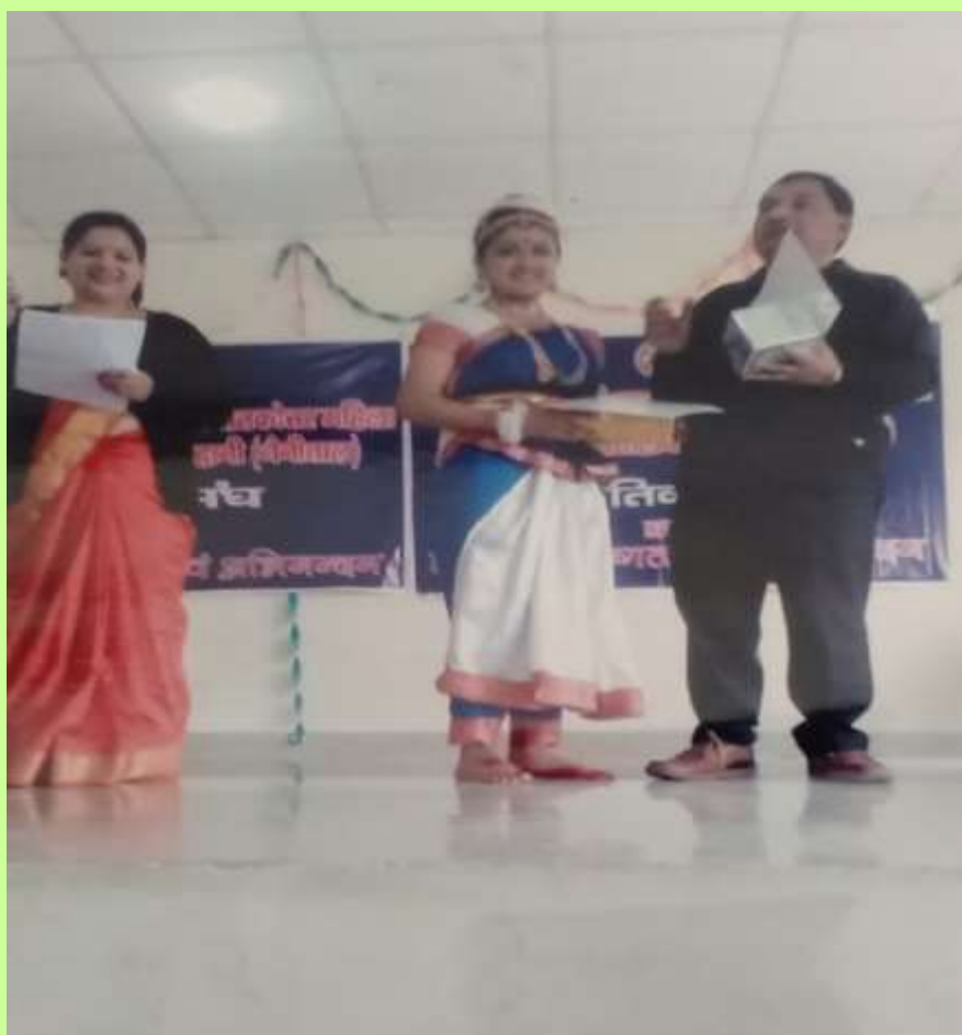
RESULT DECLARATION AND PRIZE DISTRIBUTION BY THE PRINCIPAL