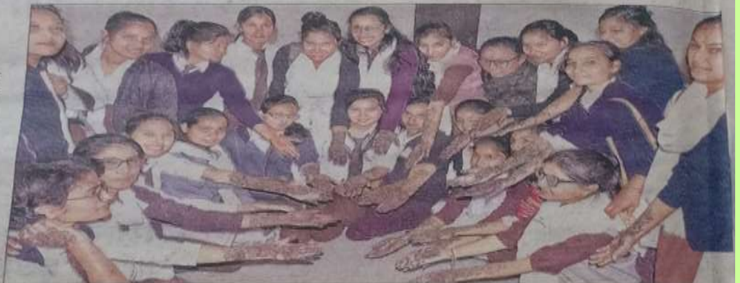
हल्द्वानी महिला कॉलेज में सांस्कृतिक परिषद एवं छात्रा संघ के संयुक्त तत्वावधान में हुए मेहंदी प्रतियोगिता में प्रतिभाग करती छात्राएं।