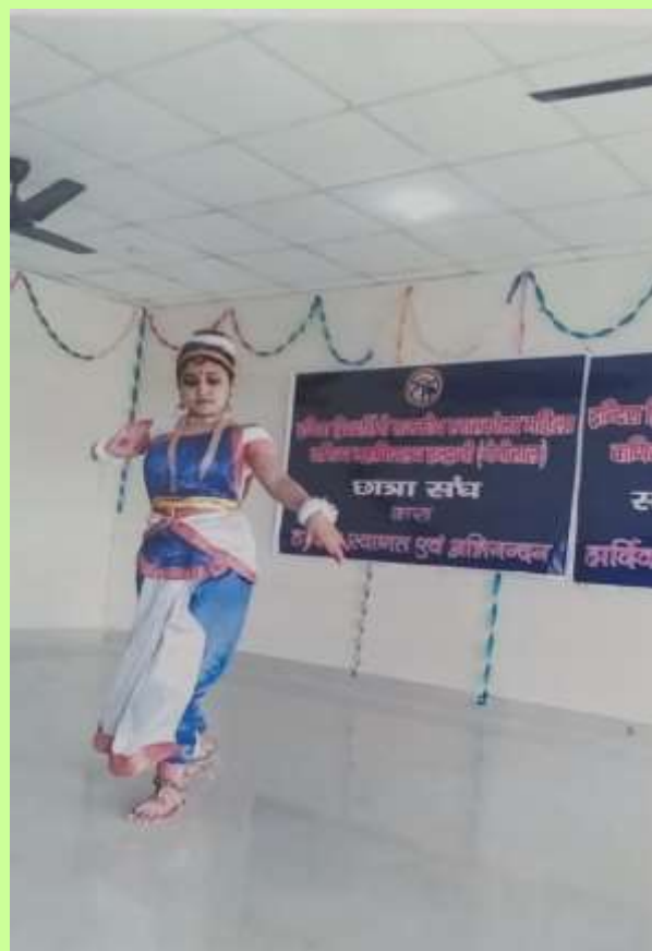
PARTICIPANTS, SHOWING THEIR MEHNDI AND PERFORMING SOLO DANCE.